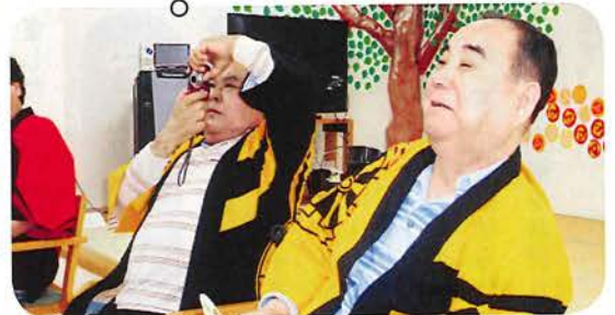
いいのが当たりました♡