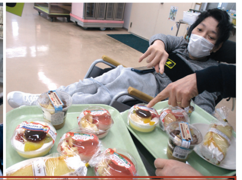
メニューは職員が準備したスイーツの中から好きなを選びます♪