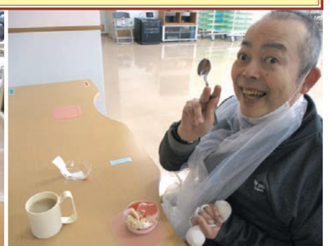
みなさん自分で選んだメニューを美味しく、いただきました。次の開店日が楽しみです♪♪