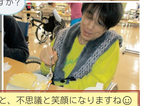
やっぱりおいしいものを食べると、不思議と笑顔になりますね◎