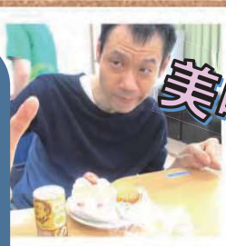
美味でございませ〜