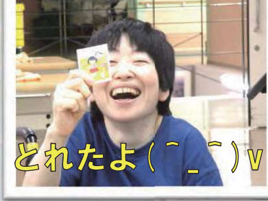
とれたよ( ^_^ )v