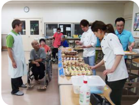
たくさんあって、迷っちゃうなあ❖