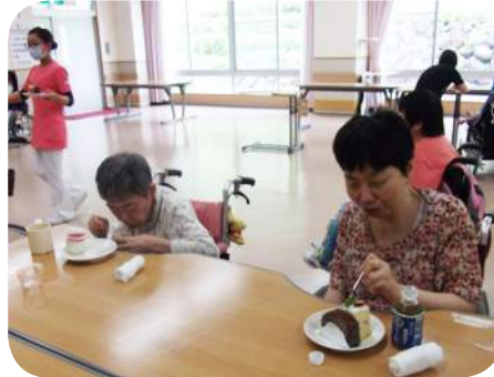
食べるのに夢中です!!