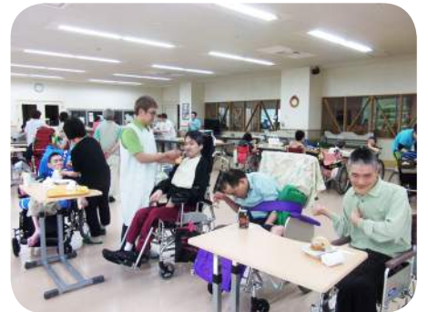
皆で美味しくいただきました♪