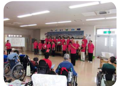
揃いのユニフォームで、素敵なハーモニー