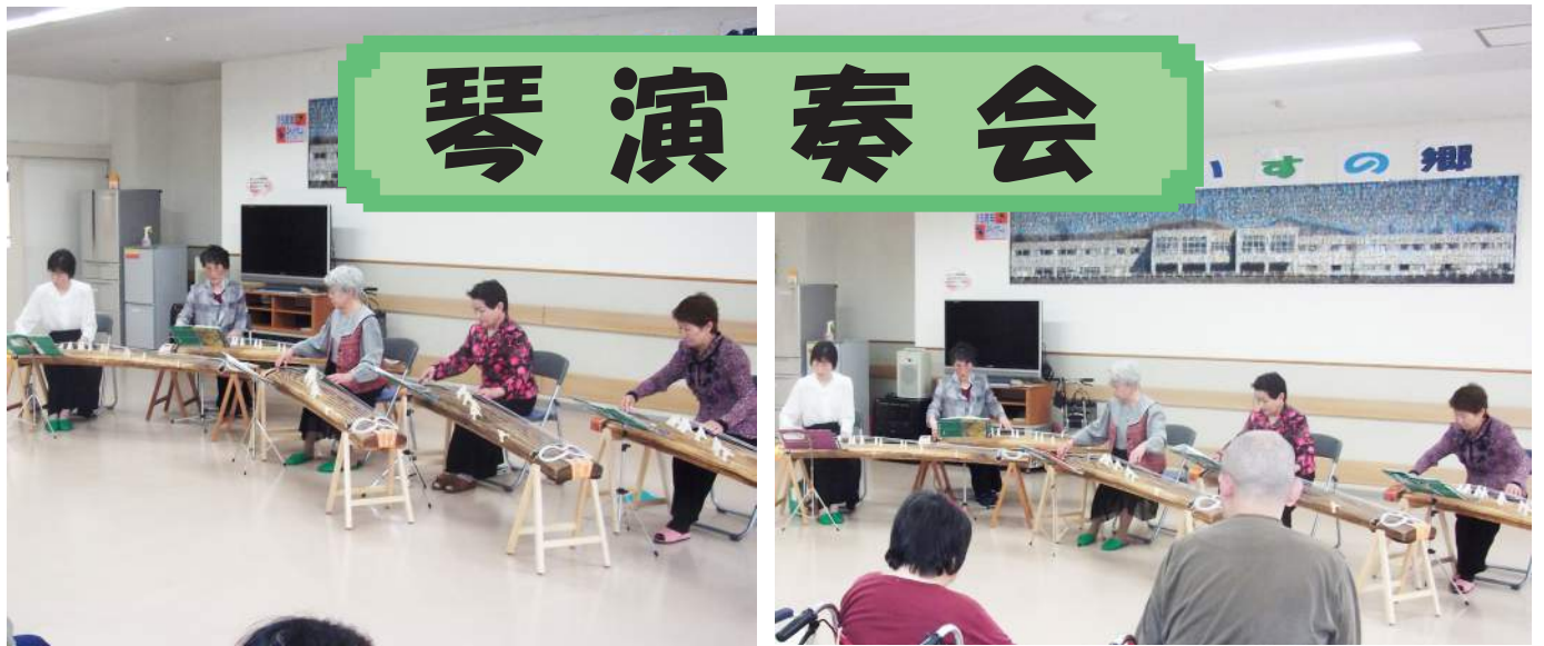
… 雫石箏曲教室の皆様 (5 月 14 日) …