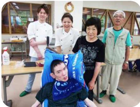
細田ファミリー、ありがとうございました♡